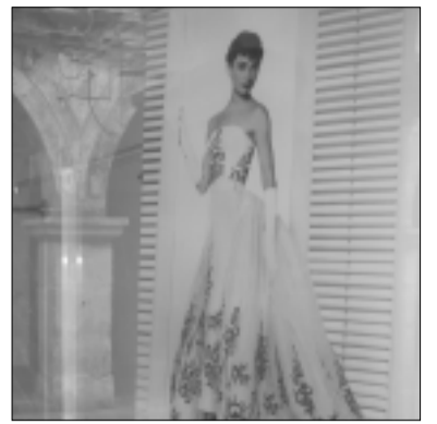
La vetrina premiata di Passaro Sposa